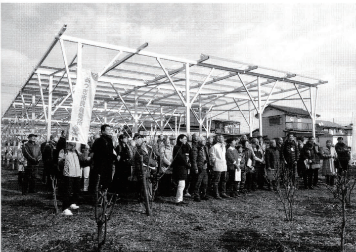
耐風性が高いスリムパネルを採用。南西端側は隣民家の日差しに配慮して撤去している。

資金は、市民から提供された基金が中心になった。拠出者は143人、総額約400万円。あとは寄付金や役員からの借入れ。厚木市からは20万円の補助があった。基金返還は17年後を予定しているという。