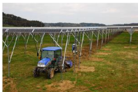
高さのある太陽光パネルの下で大豆や豆を栽培する（千葉県匝瑳市）

建設地は農地だ。パネルは地上2~3メートルと通常より高い位置に骨組みで固定してある。パネルの下で農機を使うことも可能だ。面積は東京ドームの3分の2（約3万2千平方メートル）に相当。パネルは横幅が幅広いスリムタイプで、しかも十分な隙間をあけて設置してある。この隙間により、パネルの下の農地にも日照が十分に行き渡る仕組みだ。