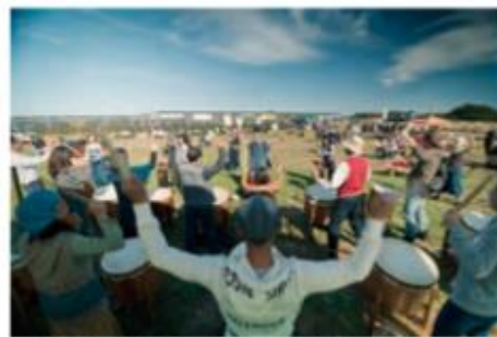
都市と農村を繋ぐソーラーシェアリング取組祭