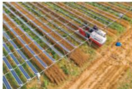
不耕起と有機栽培の麦収穫→六次化 / 雇用創出

経産省のマイクログリッド事業に採択され、共同申請者であるエネオスホールディングス㈱と協力して、まずは非常時の地域内の再エネ電力網を構築。今後は通常時も含めた地域内電力網を構築していく予定。エリア内だけでなく匝瑳市全体としての再エネと食料自給率100%実現する。