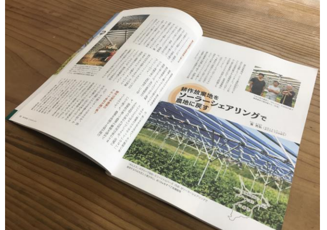
2021年Summer 「季刊地域」（現代農業者）