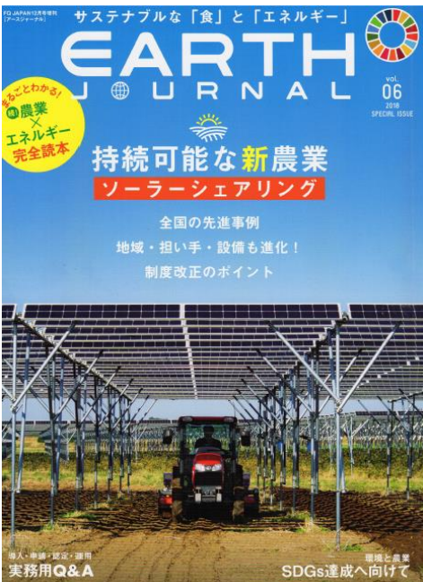
「アースジャーナル」 2018 Vol.06 SPECIL ISSUE （アクセスインターナショナル）