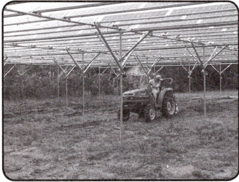
千葉県大網白里市にある光太陽農園。高さがあるので、上で発電をしても作業の邪魔にならない

ルの購入を呼びかけている。パネルは1枚2万5000円で購入、毎年賃借料が支払われる。賃借料は10年間で2万円となり、10年後には主催者が1万円で購入する契約になっている。つまり、パネルオーナーは1枚あたり10年で3万円の収入になり、5000円が増える。金額は小さいが、20枚購入すれば50万円の初期投資が10年で60万円に増える。パネルには出力保証があり、万一の場合の損害保険にも加入しているので、台風などで破損しても安心だ。耕作放棄地を減少させ、農地を活かすこともできる。市民エネルギーちばが関わるソーラーシェアリング農場は、進行中を含めて16か所。今後も各地に展開していく予定だ。